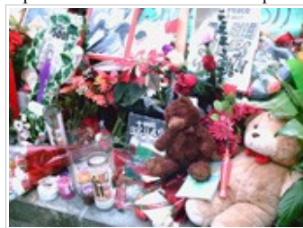
I fans ricordano James Brown alla sua statua in downtown, Augusta - Georgia.